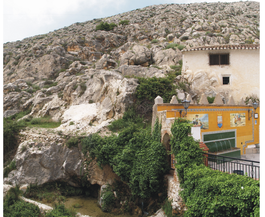
Fuente de los Caños de Caravaca (Vélez Blanco)- A. Castillo, marzo 2005