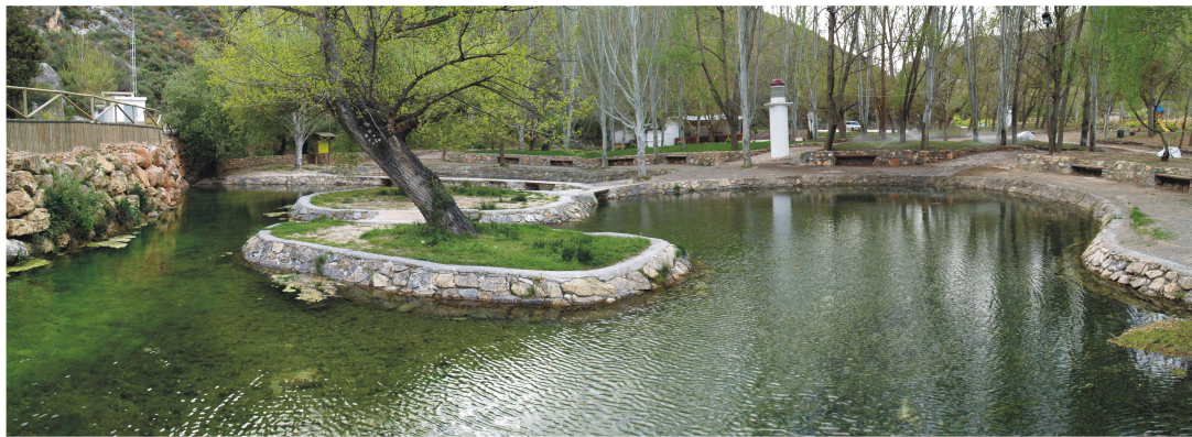
Nacimiento del Río San Juan (Castillo de Locubín)- A. Castillo, abril 2005

Actualmente es llevado a cabo por el Instituto del Agua de la Universidad de Granada. Carece de ánimo de lucro y su política es la difusión libre y gratuita de sus contenidos.