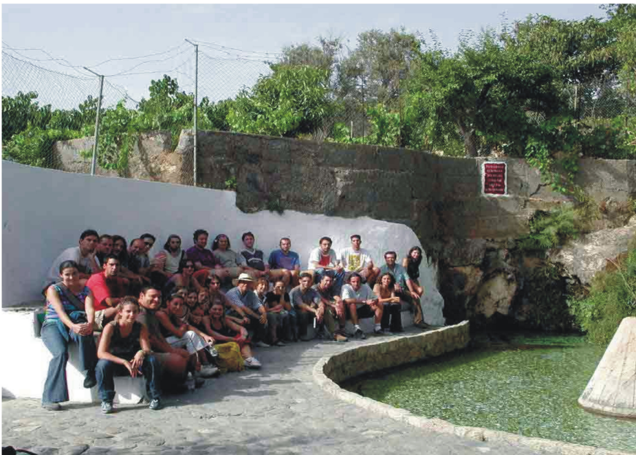
Manantial del Nacimiento (Vélez de Benaudalla)- A. Castillo, abril 2005

Entrando en www.conocetusfuentes.com , completando la información disponible y/o rellenando la ficha-encuesta de un manantial o fuente que aún no se haya incluido en el catálogo.